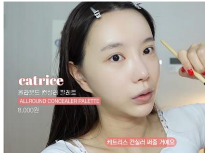
2. 브랜드 제품 리뷰