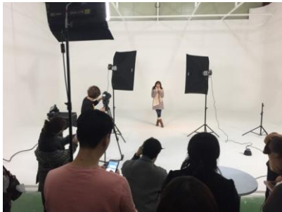
1. 스튜디오 촬영 장면